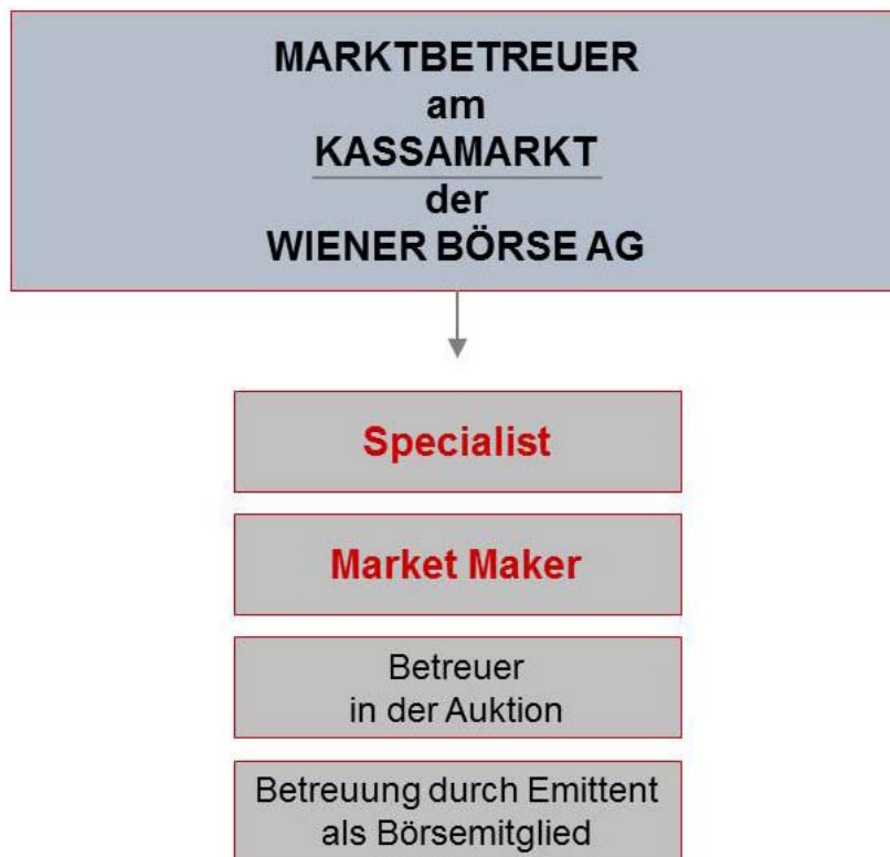
Graphik: Marktbetreuer an der Wiener Börse AG

Die vorliegende Dokumentation soll einen umfassenden Überblick über die Betreuerfunktion als Specialist bzw. Market Maker geben.