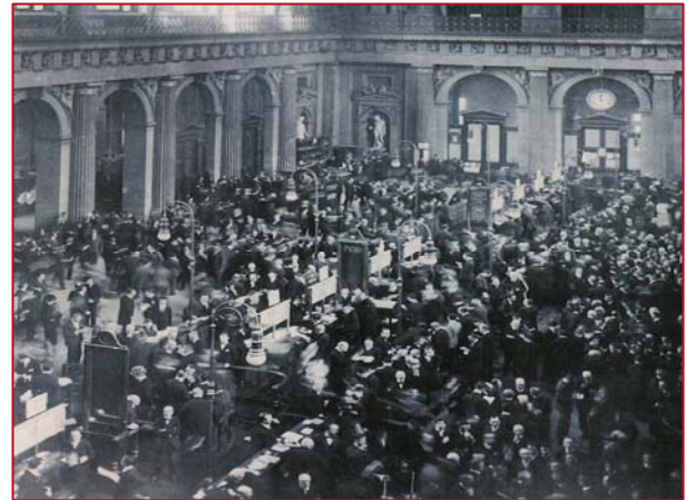
Der Handel an der Wiener Börse in den 20er Jahren

Bedeutung. Viele Wertpapiere der Nachfolgestaaten der Monarchie, wie z.B. aus Ungarn und der Tschechoslowakei wurden weiterhin in Wien gehandelt.